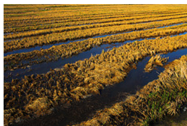
Camps d'arròs al Delta de l' Ebre.

Espanya és el segon productor europeu d'arròs, per darrere d'Itàlia. El 2010 es van produir més de 891.000 tones, el 28% del total de la Unió Europea. Andalusia és el principal productor a nivell espanyol, ja que concentra el 34% de l'arròs espanyol, després ve Extremadura amb el 24%, seguit de Catalunya i la Comunitat Valenciana amb el 15% respectivament. El balanç comercial és positiu perquè Espanya exporta gran part de la producció arrossera, principalment a països europeus. Les principals explotacions arrosseres a Espanya es situen en espais agraris d'una gran qualitat paisatgística i ecològica, i en alguns casos estan integrats en espais naturals protegits. Aquesta qualitat i singularitat de l'entorn ha de significar un valor afegit al propi producte a nivell de comunicació i de màrqueting territorial, associant-la a valors com la qualitat del producte, la sostenibilitat del territori, el foment de l'ocupació en zones rurals i la diversificació de les activitats productives.