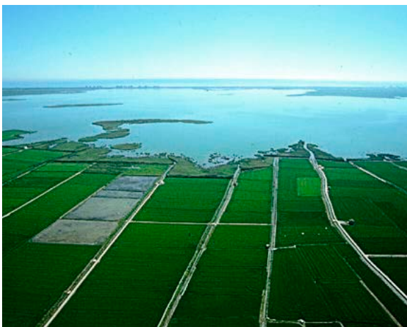
El Parc Natural de L'Albufera, a només 10 quilòmetres de la ciutat de València.

L'Albufera és una llacuna costera molt pròxima a la ciutat de València, a tan sols 10 kilòmetres al sud de la ciutat, al cor de la Comunitat Valenciana. Degut a aquesta proximitat, és un àrea fortament humanitzada i amb gran presència d'infraestructures, però que a causa de la protecció ha pogut conservar els seus valors ambientals. La zona protegida té una superfície de 21.120 hectàrees. La llacuna de l'Albufera està separada del mar per una estreta barra litoral sorrenca amb dunes estabilitzades per un bosc de pins i en el seu entorn hi ha una important zona de cultiu d'arròs, horta i cítrics. A més de ser Parc Natural des de 1986, té estatus d'Aiguamolls d'Importància Internacional, de Zona d'Especial Protecció per les Aus i de Lloc d'Interès Comunitari. Els gestors d'aquest espai tenen experiència en la gestió d'un nombre considerable de projectes de cooperació internacional, entre ells projectes LIFE i Interreg de la Unió Europea.