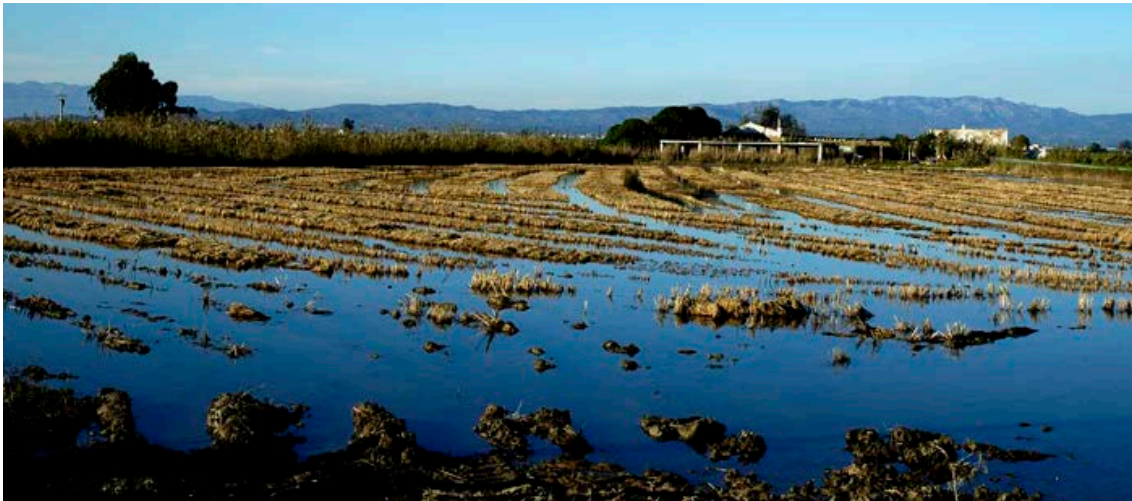
El Parc Natural del Delta de l'Ebre, a la desembocadura del riu Ebre (Tarragona).